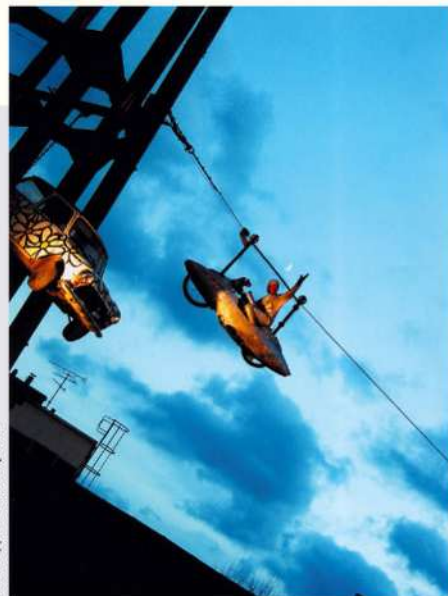
Hale Bopp

Renseignements : Ateliers Sud Side 04 91 03 10 64 www.sudside.org