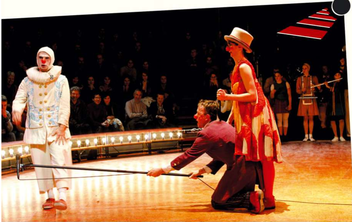
Le Cirque des Nouveaux Nez