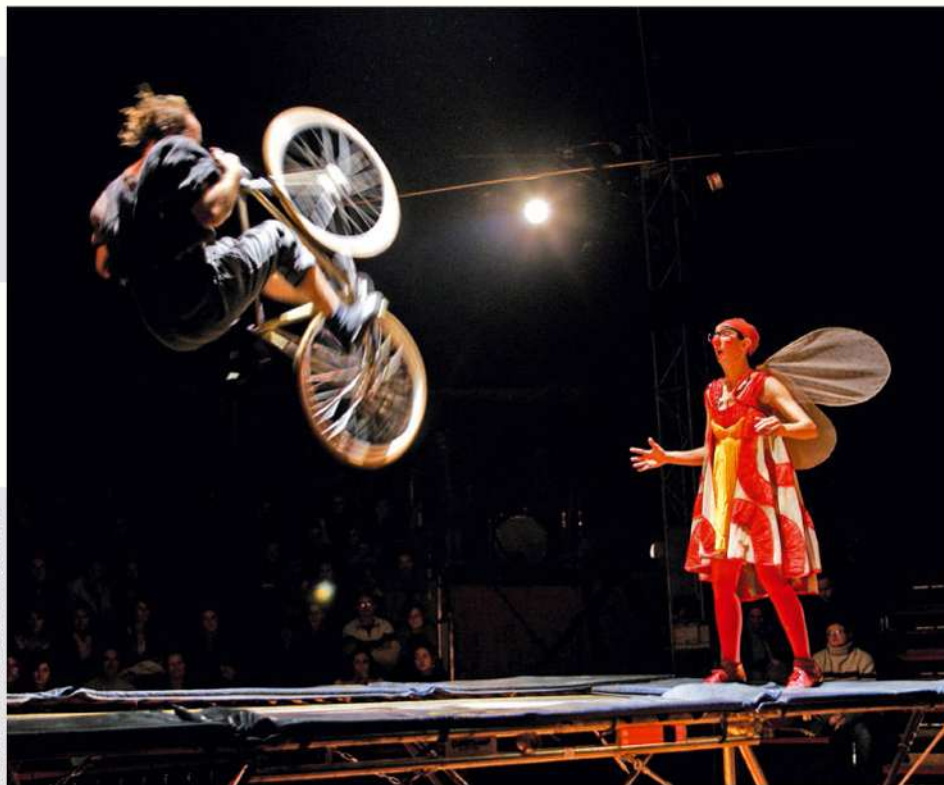
Le Cirque des Nouveaux Nez